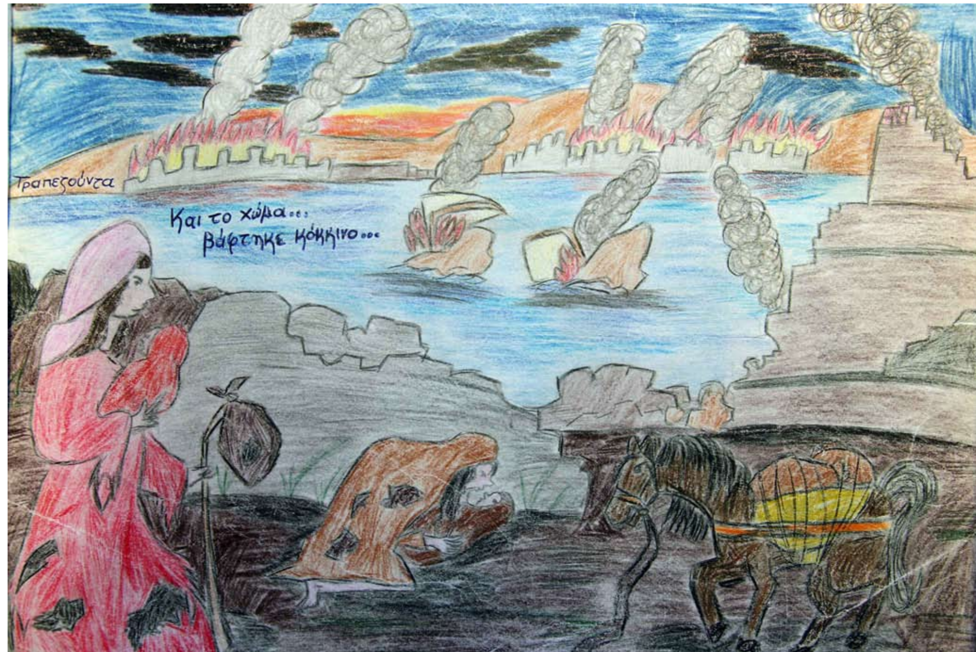
6ο Βραβείο: Ντάλλα Μηλιά, 2ο Δημοτικό Σχολείο Ηγουμενίτσας.

Τσικριτέα Βασιλική 3ο Γενικό Λύκειο Βύρωνα 3ο βραβείο Λυκείου