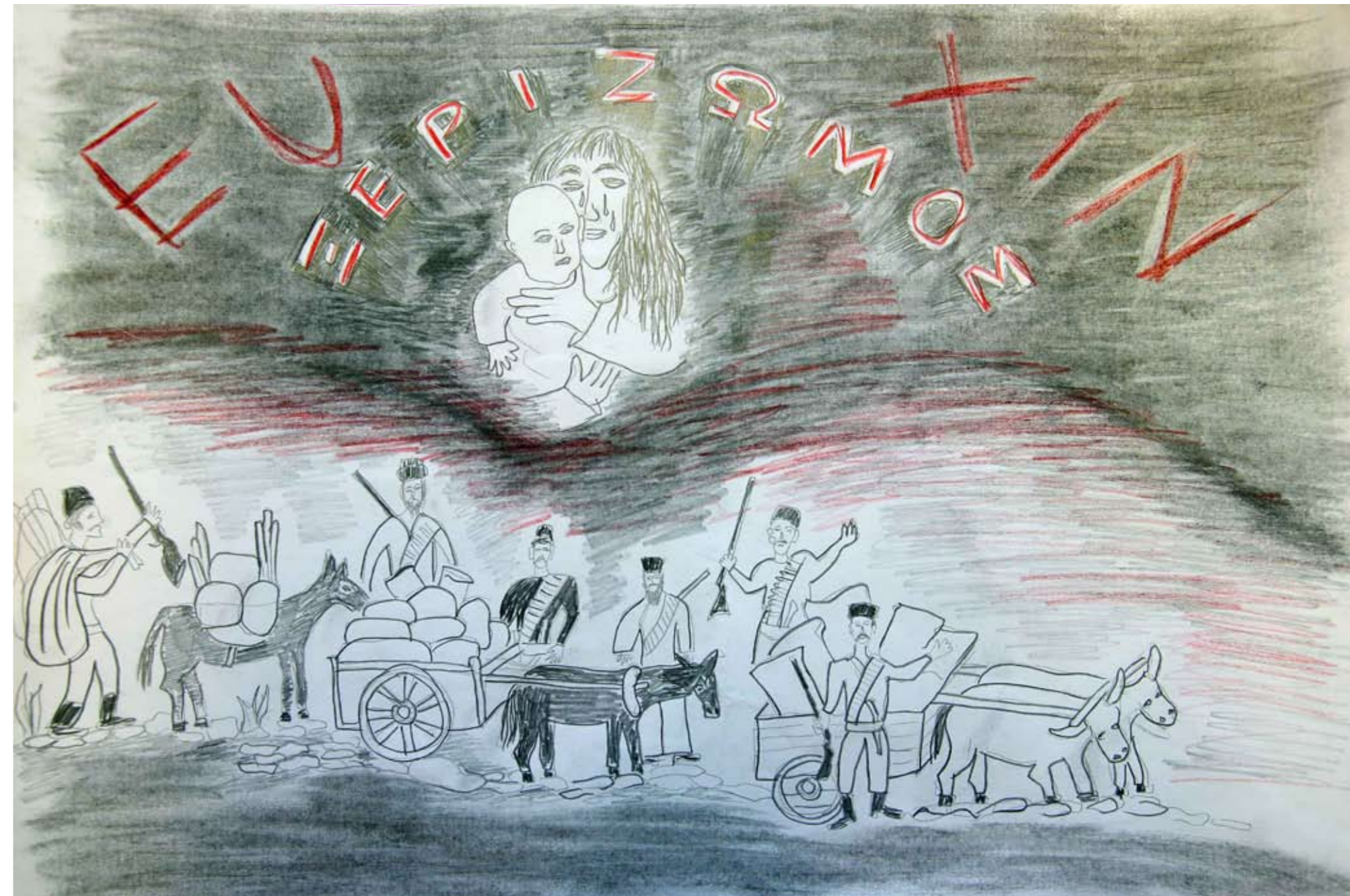
9ο Βραβείο: Λεύκα Δήμητρα, 22ο Δημοτικό Σχολείο Περιστερίου.